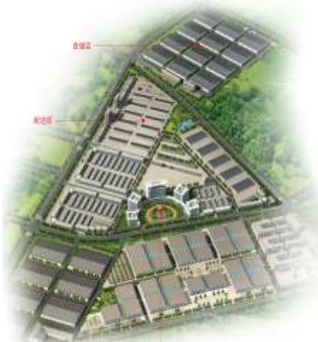
威海国际物流园效果图