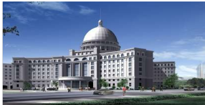
哈尔滨工业大学（威海）

临港区周边有山东大学（威海）、哈尔滨工业大学（威海）、北京交通大学（威海）、哈尔滨理工大学荣成校区、山东交通学院海运学院和威海职业学院等7所综合性高等院校；有各类职业技术学校、语言学校40余所。开设海洋生物工程系、生物工程、食品科学与工程、海洋环境与渔业系应用化学等专业，可为企业培养实用型高技能人才。